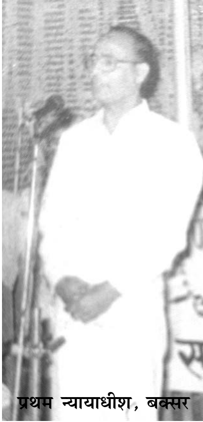
प्रथम न्यायाधीश, बक्सर